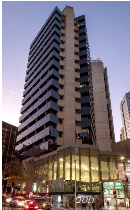
【「60 Margaret Street」施設外観】