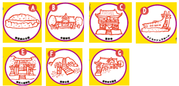
スタンプ デザイン

※本イベントは、「地域一体となった観光地の再生・観光サービスの高付加価値事業」の補助金の交付を受け、実施するものです。