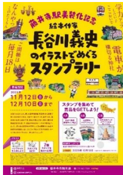
イベントチラシ デザイン

近鉄と藤井寺市は本スタンプラリーを通じて、藤井寺市の魅力を発信し、観光需要の創出に繋がりたいと考えています。