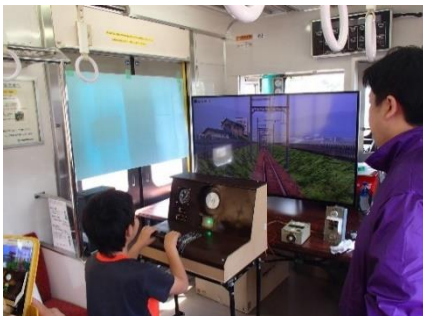
運転シミュレーション体験