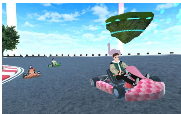
【ハルカス バーチャルサーキット（イメージ）】