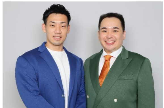
【ゲスト審査員 ミルクボーイ】