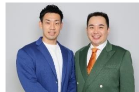
【ゲスト審査員 ミルクボーイ】