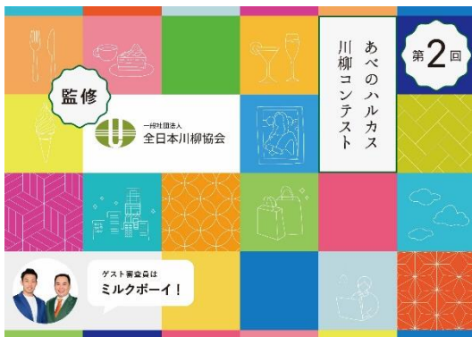
【あべのハルカス川柳コンテスト メインビジュアル】

「あべのハルカス川柳コンテスト」は川柳をつくったことがない方でも楽しんでいただける内容となっています。皆さまからのご応募を心よりお待ちしております。