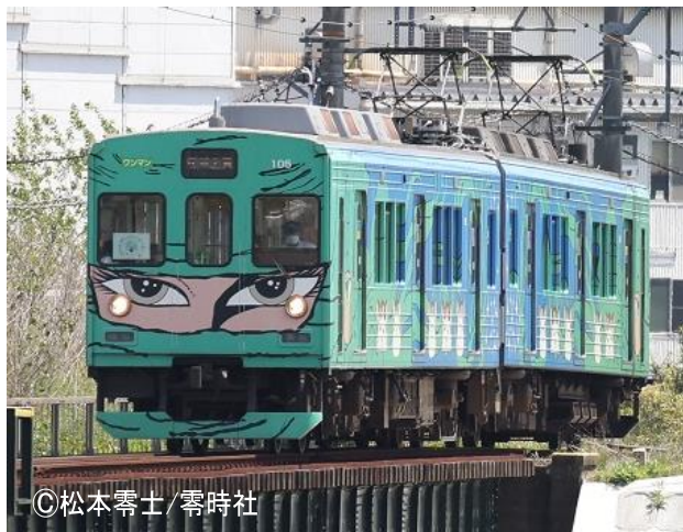
グリーン忍者列車