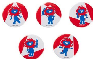
缶バッジ ミャクミャク 各種 330円