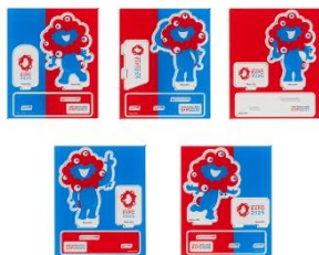
アクリルスタンド ミャクミャク 各種 1,650円