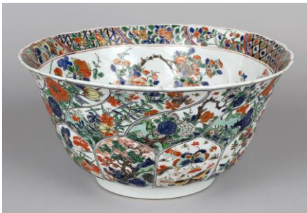
ごさいかちょうもんおおぼち 五彩花鳥文大鉢