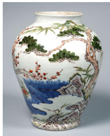
いろえしやうちくばいもんたいこ 色絵松竹梅文大壺