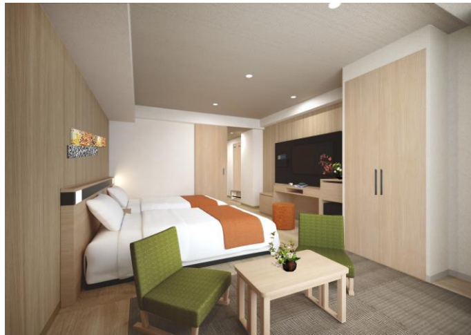
Grandeモデレートツイン ～和style～