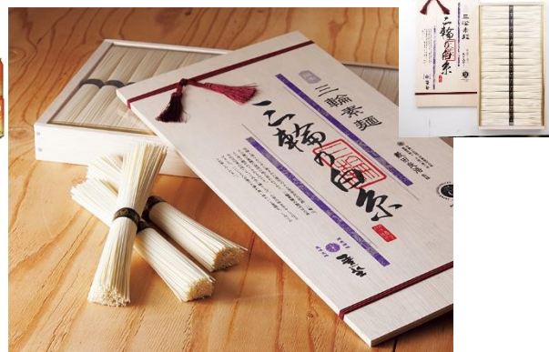
麦坐 三輪素麺 三輪の白糸 3,240 円 ★近畿2府5県送料無料