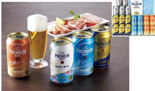
ザ・プレミアム・モルツ「輝」夏の限定4種セット 5,500 円 ★近畿2府5県送料無料