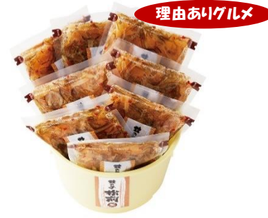
紀久屋 数の子松前 満杯詰合せ 4,860 円