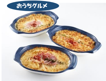
アヴァンセプラス グラタン・ドリア 3 種 8 個詰合せ 5,184 円