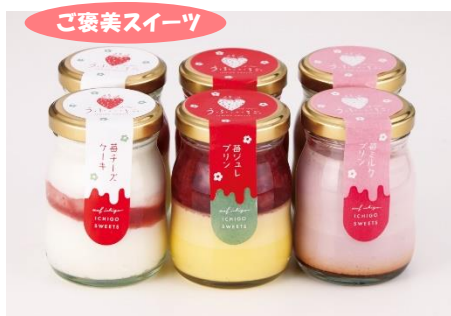
苺づくしボトルスイーツ 詰合せ 3,888 円

近年のお中元商戦では、コロナ禍で広まったイェナカ時間を大切にするライフスタイルがアフターコロナの生活でも定着し、「ご自宅用商品」に対するニーズが高まっています。アフターコロナの生活の中でも、贈り物にプラス1品「ご自宅用商品」を選んでいただきたいと思い、本年も自分やご家族に対する“ご褒美スイーツ”や“おうちグルメ”、“理由ありグルメ”を強化しました。