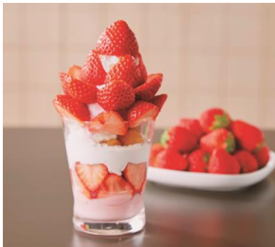
フレッシュイチゴを 贅沢に使用したパフェ