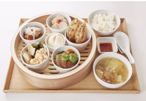
水の流れるように次々と出てくる台湾の 食文化「流水席」を定食にアレンジ