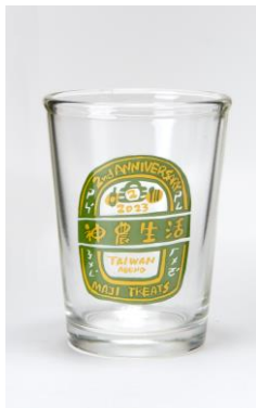
食卓を彩るレトロなデ ザインがキュート