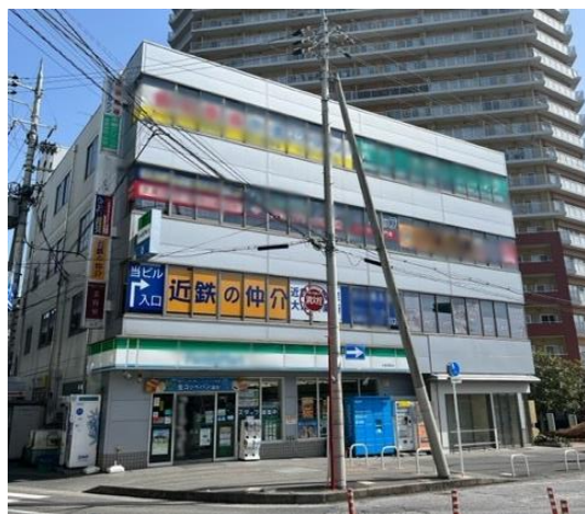
【大津営業所が入居する西大津ISビル（2階）】

名 称： 近鉄の仲介 大津営業所 所 在 地： 大津市皇子が丘二丁目10番27号 （西大津ISビル2階-A） 交 通： JR湖西線「大津京」駅 徒歩1分 営業開始日： 2023年4月1日（土） 営業時間： 9：30～18：20 定 休 日： 水曜日・木曜日 問 合 せ： TEL：077-510-0202 FAX：077-510-0203 ツリコール：0800-222-0202 E-mail：e-otsu@kintetsu-re.co.jp