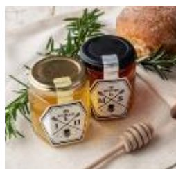
奈良・室生 そよご c.140g 1,512 円～