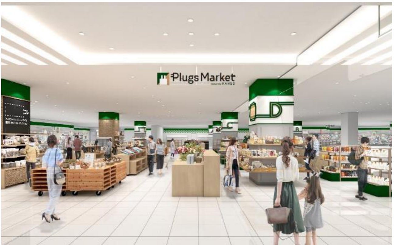
プラグス マーケット近鉄橿原店 伝え場イメージパース

近鉄百貨店橿原店は地域活性化を目指した活動を推進するため、2021年に橿原市と「包括的連携に関する協定」を締結しており、さらに2月28日には十津川村と「地域創生の相互連携に関する協定」を締結しました。今後とも地域の活性化に貢献し、地域の皆様にとってなくてはならない魅力ある店づくりをすすめてまいります。