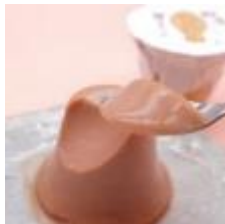
3月18日(土) 桜井市<神亀堂> 観音ぷりん 300円