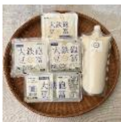
充填豆富 b.400g 420 円