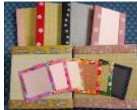
大和高田市 <岩本商店>