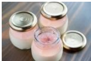
3月16日(木) 吉野町<静亭> 葛布林 350円