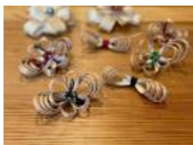
下市町 <花井商店> 面皮細工 2,200 円～

自然や歴史、農林業の営みを身近に感じ共存するライフスタイルがここ中南和の暮らしに根付いています。地域の作り手(生産者・クリエイター)とつかい手(お客様)をつなぐ「伝え場」のオープニングイベントとして、吉野から木工製品や草木染のほか、八重桜をモチーフとした金属工芸品など、地元素材に職人の腕を加えた逸品を取り揃え、春を感じる売場を演出します。