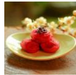
南高むかし梅干 d.200g 972 円