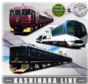
ウォッシュタオル 1,000円

1923年に畝傍線(※現在の橿原線:橿原神宮前駅～大和西大寺駅間)が全線で開通してから、2023年3月21日(火・祝)で100周年を迎えることを記念して記念グッズを販売します。※売り切れ次第終了