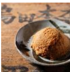
麴味噌 a.400g 648 円

奈良県の隠れた地場産品を常設で扱います。「大和の素(す)」「大和のおもてなし」「大和の伝統」のテーマで、ギフトに良し、日常に良し、まほろばライフを楽しめるいいものを県内各地からご提案します。