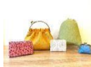
桜井市 <神楽> 印傳 がま口コインケース他 3,800 円～