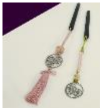
三郷町 <Garally 華倭里> 帯飾り 5,940 円 根付 4,180 円