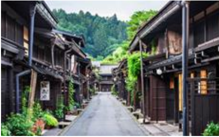
高山市内 古い町並み