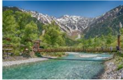
上高地・河童橋から見える穂高連邦