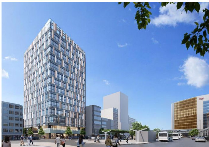
東側(国道1号線方面)より