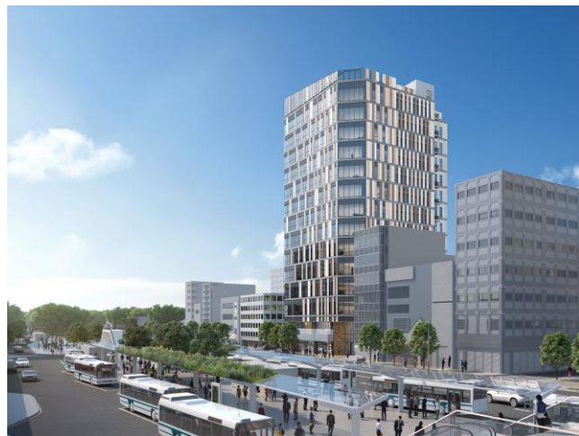
西側(近鉄四日市駅方面)より