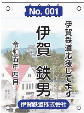
うえのまちプレート （ポリカ+ツグ イットラミネート）