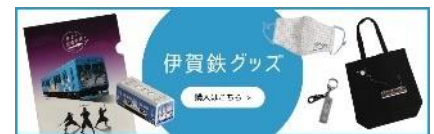
伊賀鉄グッズバナー

伊賀鉄道ホームページの中程にある「伊賀鉄グッズ」のバナーを押下してください。「いがてつオンラインショップ」に遷移しますので、商品一覧より「まくら木オーナー」各コースの商品を選択ください。