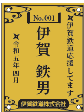
ゴールドプレート （アルミ複合板+UV印刷仕上げ）