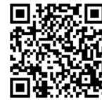
アプリ紹介サイト