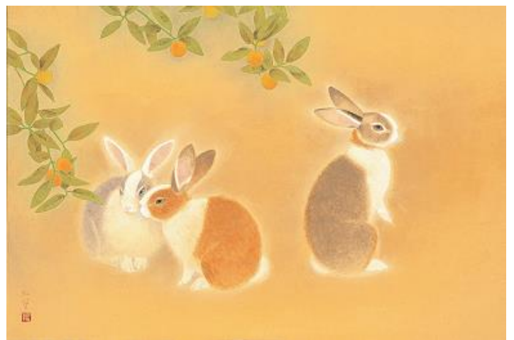
上村松篁「兔 I」昭和62年(1987)