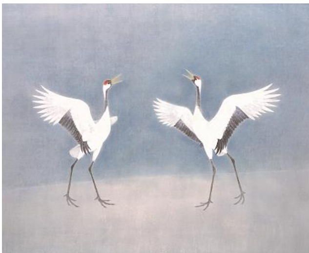
上村淳之「双鶴」平成9年(1997)