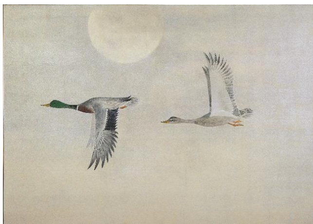
上村淳之「飛鴨」昭和 61 年（1986）