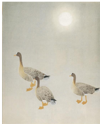
上村松篁「雁金」昭和 57 年（1982）