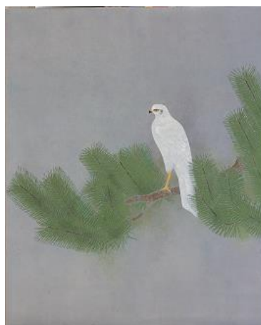
上村淳之「白鷹」平成 13 年（2001）