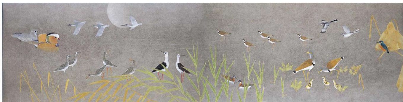
上村淳之「水辺の四季」平成 21 年（2009）