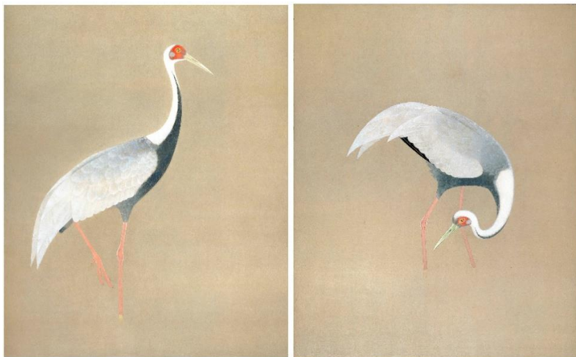
上村松篁「真鶴」昭和 55 年（1980）