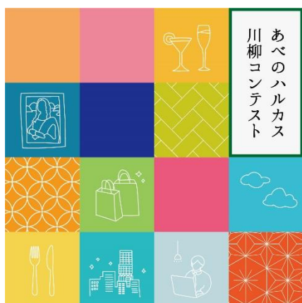
【あべのハルカス川柳コンテスト メインビジュアル】