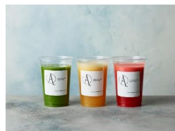
■アンサースムージー(イメージ)