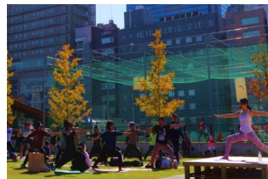
■プチヨガ風景(イメージ)