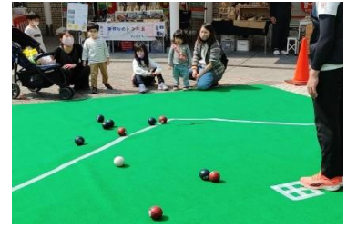
■ポッチャ体験(イメージ)