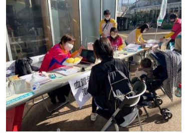
■測定風景(イメージ)