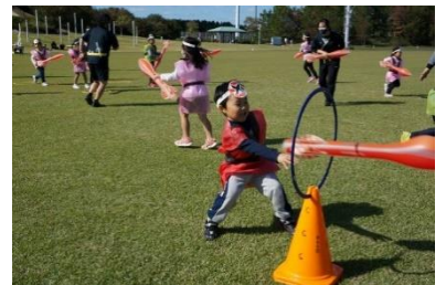
■忍者学校(イメージ)