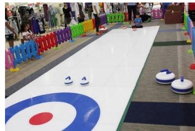
■カーリング体験(イメージ)