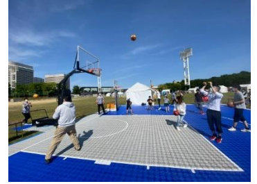
■バスケットボール体験(イメージ)