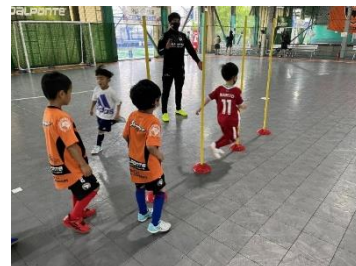
■フットサル体験(イメージ)