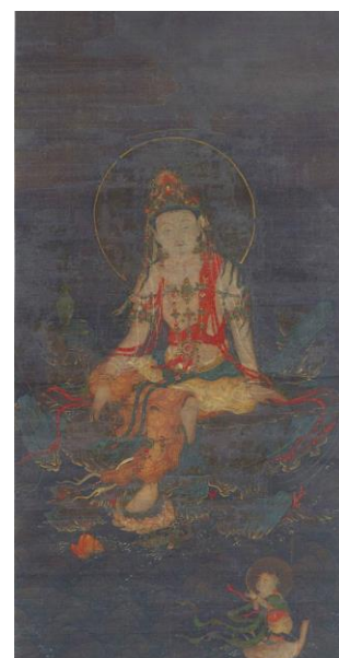
楊柳観音図 高麗時代