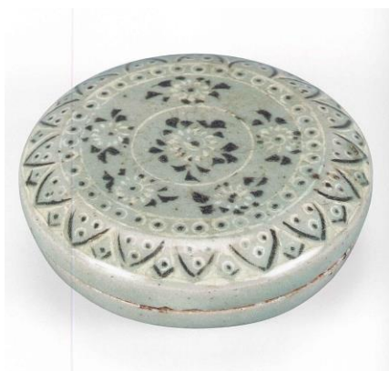
青磁象嵌花文合子 高麗時代