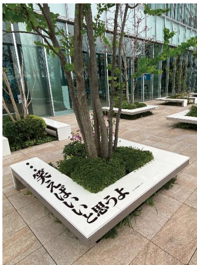
【16階屋外庭園 イメージ】