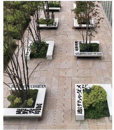
【16階屋外庭園 イメージ】

あべのハルカス美術館のある16階屋外庭園のベンチに、庵野秀明氏の関連作品である『ふしぎの海のナディア』や「エヴァンゲリオン」シリーズ、『シン・ウルトラマン』などの名台詞やキーワードを装飾いたします。17階ロビーからもお楽しみいただけます。