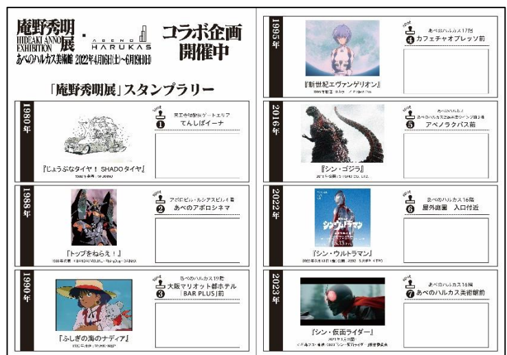
【スタンプラリー用紙 イメージ】