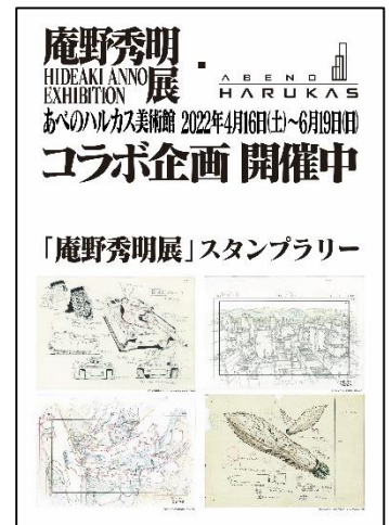
「庵野秀明展」スタンプラリー

※ラリー用紙に7つのスタンプを集められた方の中から抽選で、「庵野秀明展」公式グッズ詰め合わせを1名様にプレゼントするTwitterキャンペーンを開催いたします。