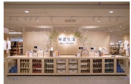
神農生活近鉄あべのハルカス店