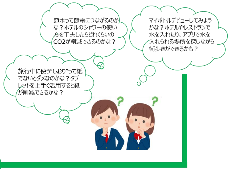
生徒が自ら考えた項目をBINGOに入れる

一連の学習の流れについて「カーボンスタディ」ワークキット利用のための説明オリジナル動画をご用意しています。