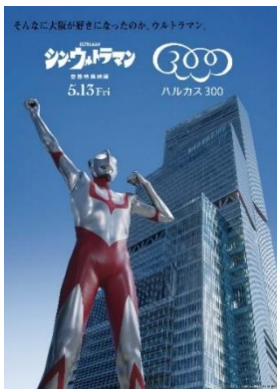
【コラボビジュアル】