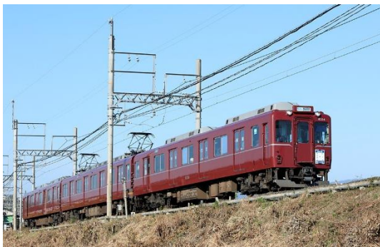
田原本線を走る一般車両