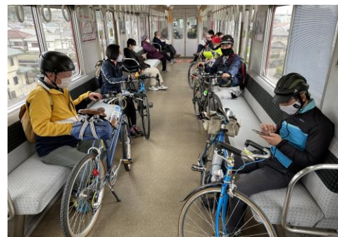
実証運行時の様子（2022年3月9日）