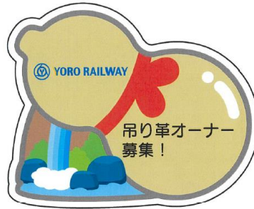
表 (メッセージ: 21文字まで)