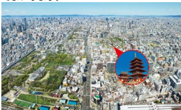
【ハルカス300（展望台）から望む四天王寺 イメージ】

本イベントを通して、近鉄グループ、四天王寺や地域を支える自治体等が連携し、見て、聴いて、遊んで、学べる聖徳太子の歴史と地域資源を活用した魅力を、より多くの方々に発信できるよう運営してまいります。