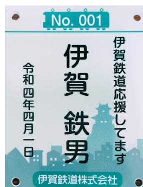
Bコース （ツツァ イットラネット仕上げ）