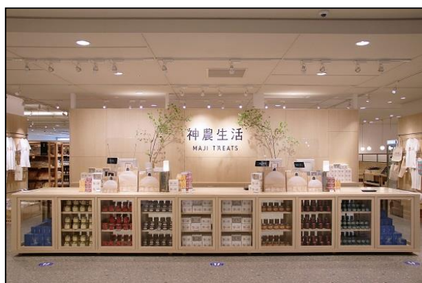
神農生活 近鉄あべのハルカス店