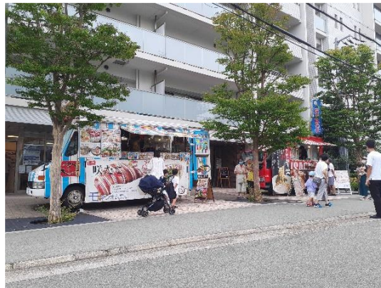
【キッチンカーイメージ】