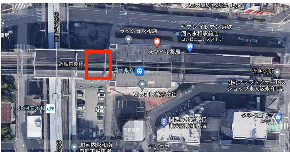
出店場所 近鉄河内永和駅高架下