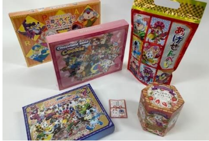
福袋 (お菓子) 3,000 円