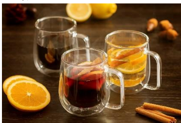
「ホットワイン」「ホットサングリア」 570円【テーマパーク】 アルハンブラ、 ミカサ、エルパティオ

志摩スペイン村のオフィシャルスポンサーであるアサヒビール株式会社とのコラボキャンペーンとして、身も心もホッと温まる「ホットワイン」「ホットサングリア」を販売いたします。また、ホテル志摩スペイン村では微アルコールビール「ビアリー」を特別価格にて提供する「ビアリーフェア」を実施いたします。