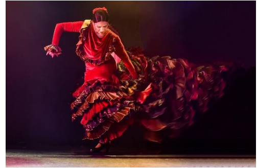
泊さん撮影のフラメンコダンサー