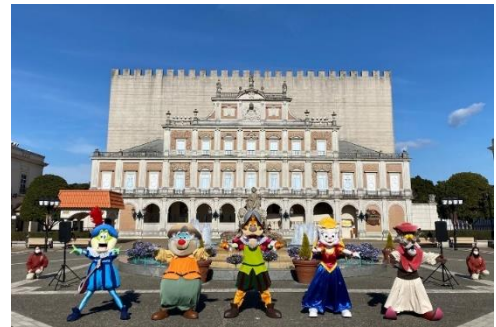
シベレス広場で踊るキャラクター達