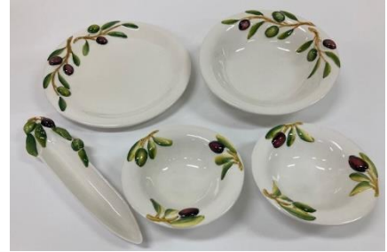
福袋 (陶器セット) 5,000 円、10,000 円 スペイン製陶器、イタリア製陶器等