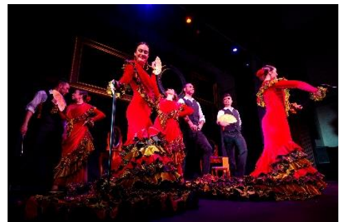
「クラシコス・ザ・フィルム」