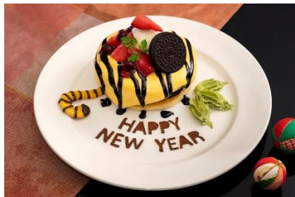
「とらどしニューイヤーパンケーキ」 単品1,200円、ドリンクセット1,520円 【テーマパーク】 カフェ ミカサ