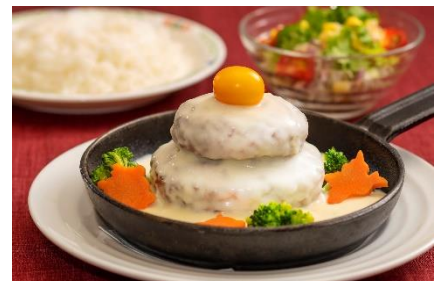
「鏡餅風お正月ハンバーグセット」 1,650円 【テーマパーク】 レストラン エルパティオ