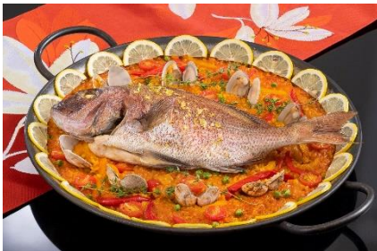
「伊勢志摩産真鯛（養殖）のパエリア」 約4人前 8,800円 ※数量限定 【テーマパーク】 レストラン アルハンブラ

新年をお祝いする年末年始限定の特別メニューが登場いたします。スペイン料理のパエリアに、日本の縁起ものである三重県産の「真鯛（養殖）」を合わせた“めで鯛”メニューをはじめ、2022年の干支である寅をモチーフにしたスイーツや、鏡餅に見立てたハンバーグなど、お正月の特別感を味わえるメニューをお楽しみください。