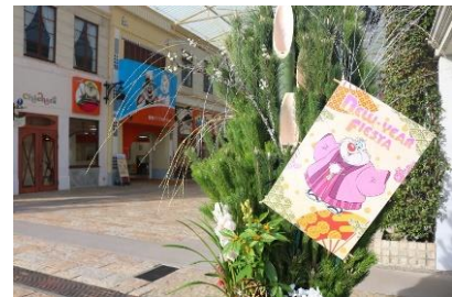
テーマパークの門松

テーマパーク、ホテル志摩スペイン村、ひまわりの湯の入口に門松を設置し、皆さまをお迎えいたします。テーマパークのエントランスには着物を着たドンキホーテとサンチョパンサがデザインされた門松を飾ります。