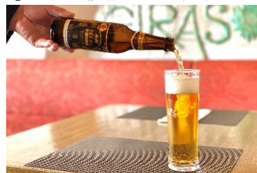
「ビアリーフェア」 300円（通常価格の半額） 【ホテル志摩スペイン村】 ヒラソル、志摩

※未成年者の飲酒は法律で禁止されております。 20歳以上であることを確認できない場合には お酒の販売はいたしません。