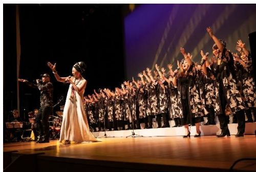
【ゴスペルステージ イメージ】