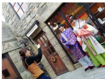
【万葉衣装体験 イメージ】