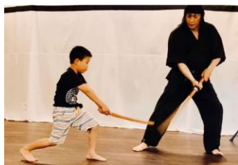
【殺陣体験 イメージ】