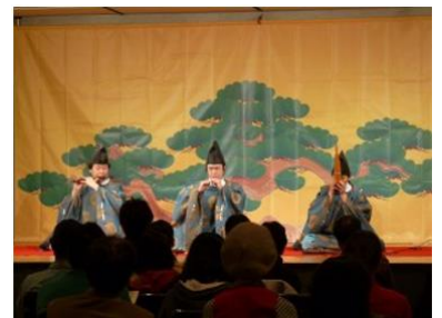
【10日】雅楽演奏 イメージ