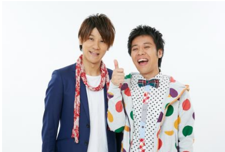
【ゲストタレント スマイル】

クイズ賞品：・大阪市立美術館「聖徳太子展」ご招待券 ・てんしばオリジナルグッズ（レジャーシート、バック）など