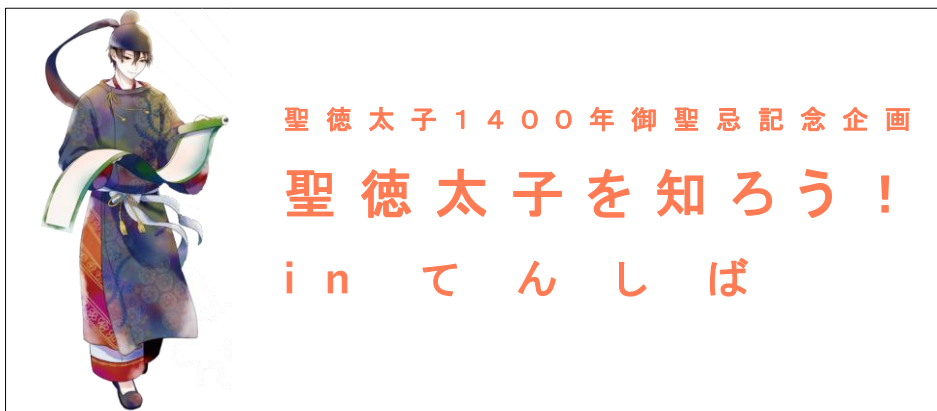
【「聖徳太子を知ろう！ in てんしば」 イメージ】