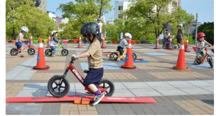
【縁日イベント イメージ】