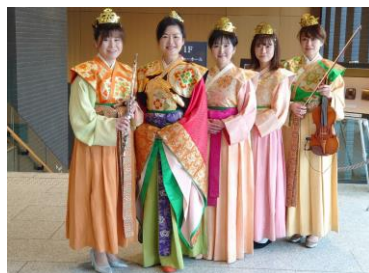
【万葉衣装 イメージ】

時 間：10月 9日（土） ①12：00～12：20 ②15：00～15：20 10月10日（日） ①13：30～13：50 ②16：00～16：20 内 容：万葉衣装をまとい、聖徳太子、蘇我入鹿、推古天皇を模した3名のアクターたちが公園内でグリーティングを行い、来場者との記念撮影も実施します。