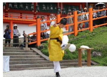
【けまり体験 イメージ】