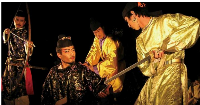
【エンターテインメント劇 イメージ】