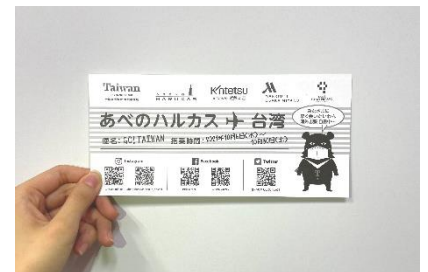
【クイズラリー用紙 イメージ】