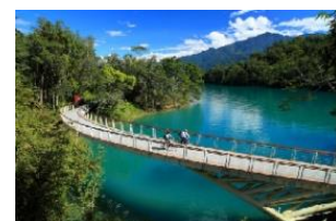
【写真展 イメージ画像】