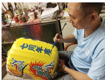
【手描きのオリジナルランタン】