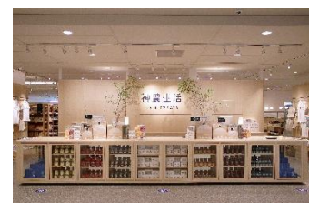
【神農生活 イメージ】

【販売日時】 10月 9日（土）、10日（日）、 16日（土）、17日（日）、 23日（土）、24日（日）、30日（土） 各日11:00～17:00