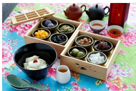
【台湾スイーツ「豆花」】