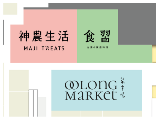
【あべのハルカス近鉄本店 10階 フロアマップ】

台湾の家庭料理が楽しめるレストラン「食習」や、日本最大級の品数を取り揃えた台湾茶のセレクトショップ「Oolong Market 茶市場」も同時にオープンし、台湾を存分に楽しめる3つのゾーンが誕生しました。コロナ禍で海外旅行に行けない今、台湾の食、雑貨などのライフスタイルに触れることで、台湾旅行気分を手軽に楽しめます。