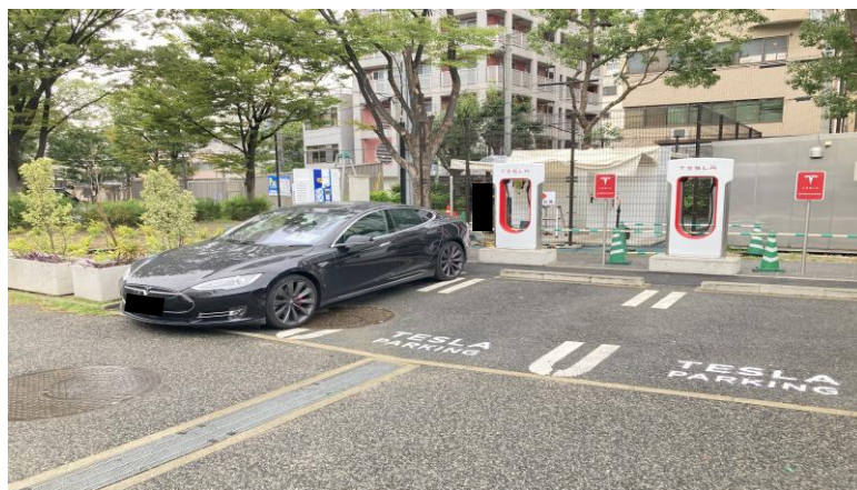
【テスラ スーパーチャージャー イメージ】