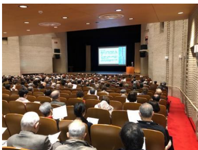
大和文化会「月例講演会」の様相 （2020年2月）