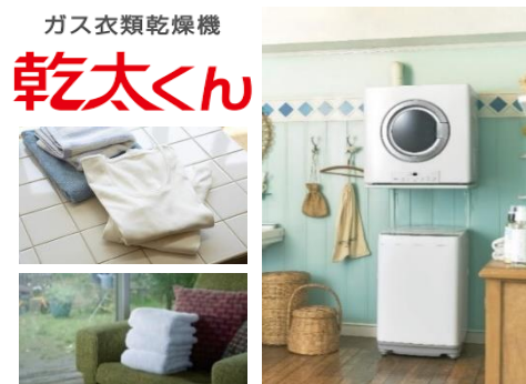
【ガス衣類乾燥機「乾太くん」イメージ】