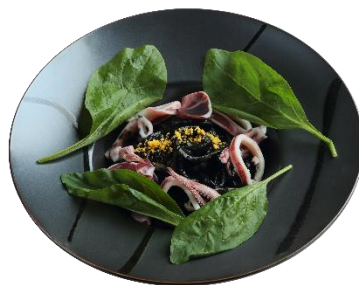
漆黒のイカスミうどん