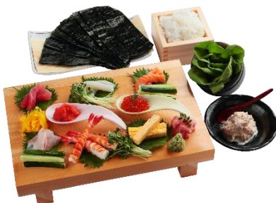
手巻き寿司セット (3名さま分) 3,600円

お連れさま、ご家族さまとでもお楽しみいただけるセットメニューをご用意しております。