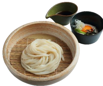
伊勢芋とろろのつけうどん