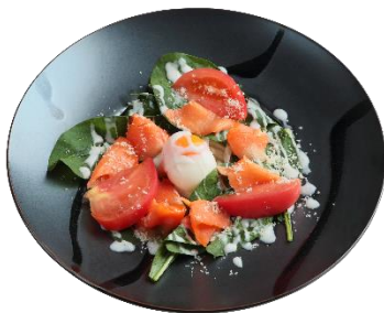
ほうれん草とスモークサーモンのうどん