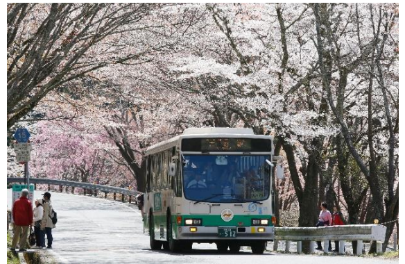
▲吉野山を走る臨時バス