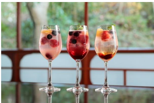
〈フルーツ&ピネガードリンク〉