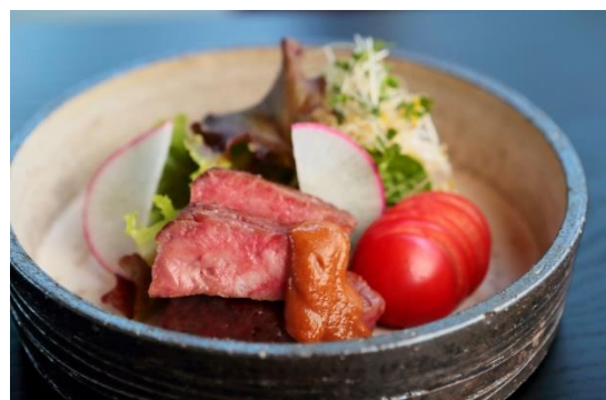
〈（オプション）大和牛ローストビーフ〉