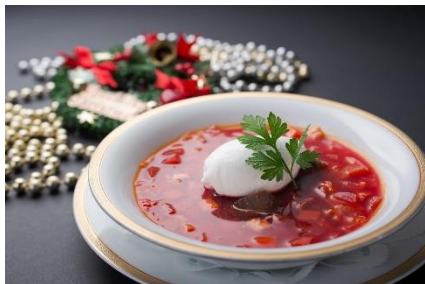
「三重県産鹿肉のスープ仕立て」

【予約方法】 ネット予約限定 ※ホテル志摩スペイン村公式ホームページからご予約ください。