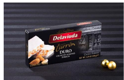
「アーモンドトゥロン」980円