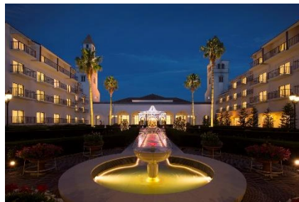
イルミネーション輝く中庭