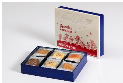
「クリスマスオリジナル フールセック」19個入り 1,400円

クリスマス衣裳に身を包んだキャラクターデザインの「フルセック」や、スペインのクリスマスにはかかせない伝統菓子「ポルポロン」、「アーモンドトゥロン」などを販売いたします。