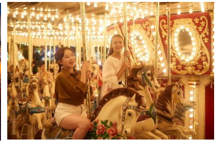
イルミネーション輝く 幻想的な「ガウディカルーセル」