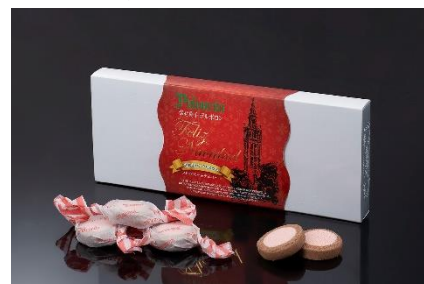
「クリスマスオリジナル ポルポロン」8個入り 800円