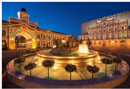
シベレス広場のイルミネーション