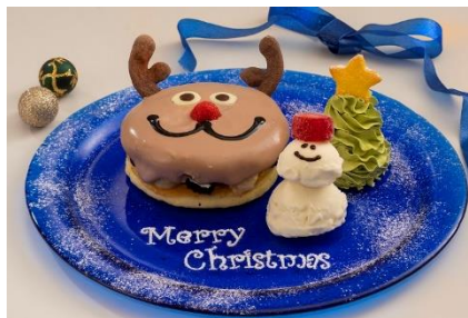
「クリスマスパンケーキ」単品1,200円 ドリンクセット1,520円 【テーマパーク】カフェ ミカサ