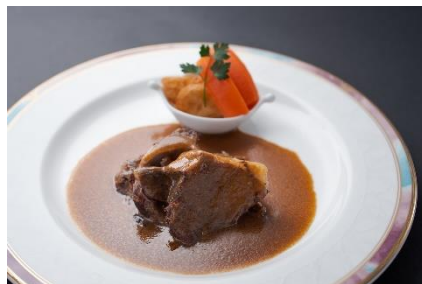
「三重県産イノシシの赤ワイン煮」