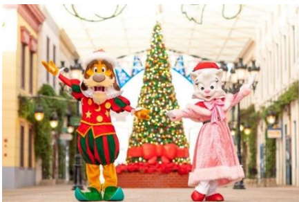
クリスマスビッグツリーと キャラクター達

色とりどりの装飾や大きな赤いリボンでデコレーションされた高さ約7mのクリスマスビッグツリーがエスパーニャ通りに登場し、皆様をお出迎えいたします。キャラクター達もクリスマス衣裳に身を包み、パークを楽しく盛り上げます。さらに、夕暮れ時から、パーク全体が約20万個のイルミネーションやライトアップで光り輝き、昼間とは違った幻想的な景色が広がります。あたたかな光に彩られた「シベレス広場」をはじめとする異国情緒あふれる街並みやアトラクションをお楽しみください。