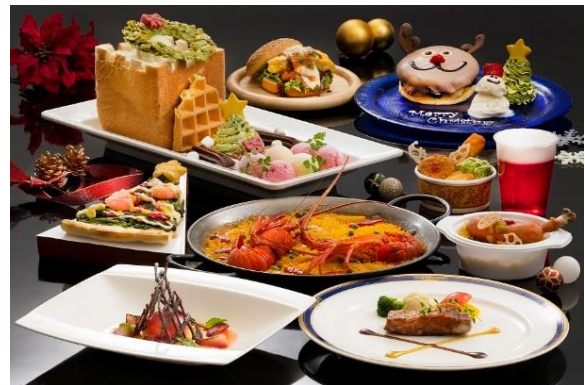
スペシャルメニュー

テーマパーク、ホテルではクリスマス为主题にしたメニューが勢揃い。トナカイやツリー、リースなどをモチーフにした華やかなメニューをご堪能ください。