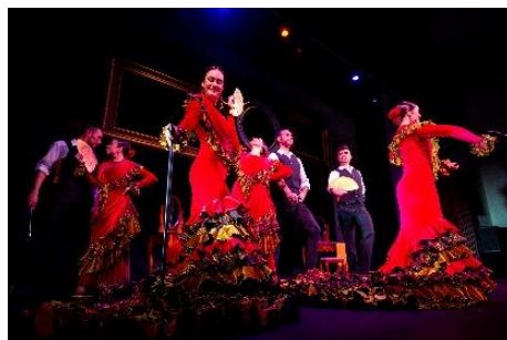
「クラシコス・ザ・フィルム」