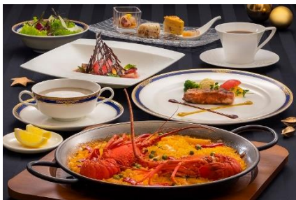
「クリスマスコース」5,000円 【テーマパーク】レストラン アルハンブラ ※数量限定