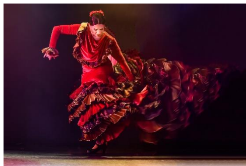
フラメンコダンサー