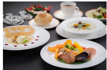
「クリスマスランチ」2,500円 【ホテル】カフェ&スペイン料理 ヒラソル ※営業時間 11:30～13:30