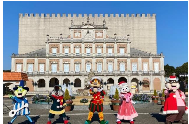
シベレス広場で踊るキャラクター達