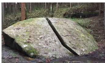
▲一刀石（「柳生」バス停車、徒歩約20分）

上記以外にも人気漫画で話題の一刀石がある柳生や紅葉の名所である談山神社、飛鳥などへは、バスでのお出かけが便利です。