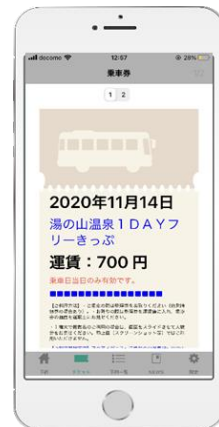
チケット(イメージ)