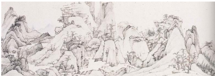
江山無尽図巻（部分） 漸江筆 清時代 泉屋博古館蔵 ※展示は10月25日（日）まで【前期展示】