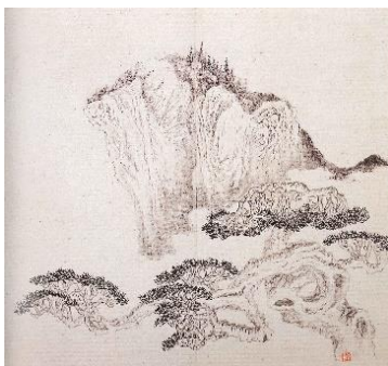
山水図冊（第五図） 方士庶筆 清時代 大和文華館蔵