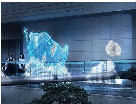
【2階外周デッキあべのべあイルミネーション（イメージ）】