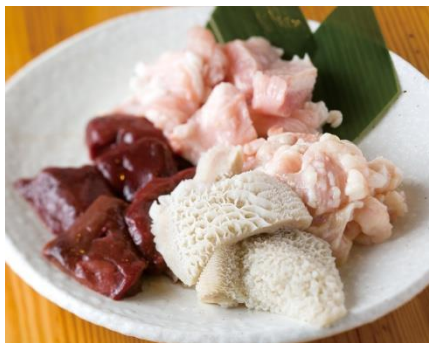
ごちゃまぜ新鮮ホルモン盛