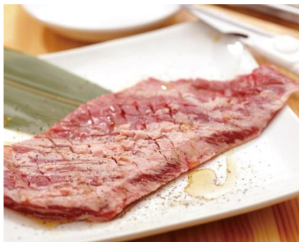
名物ドデカはらみ