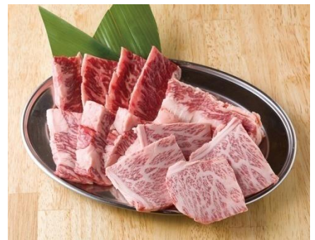
赤身肉オールスター盛