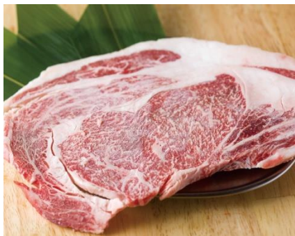
黒毛和牛どでかコース