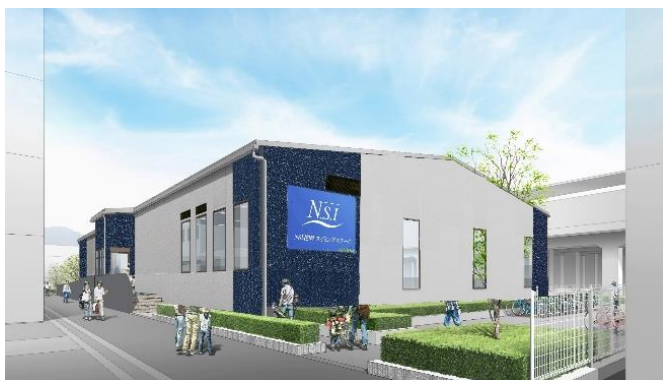
【店舗外観イメージ】

株式会社エヌ・エス・アイは現在、大阪府下で9店舗、西日本を中心に44店舗(指導受託・指定管理含む)を運営しており、「礼儀・感謝・挑戦」の理念の基、「笑顔・心の豊かさ」に日々磨きをかけ安全と安心を最優先に社会から信頼される企業を目指し、これまで以上に地域の皆様に一層愛される店舗を目指します。