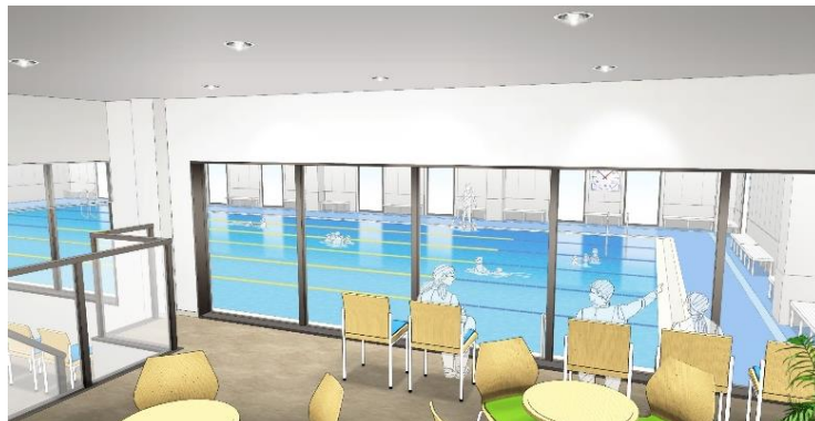
【店舗内イメージ(観覧席)】