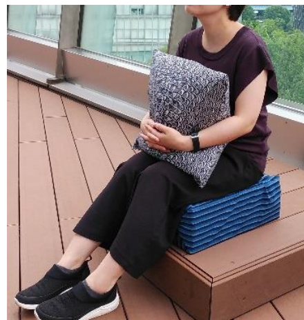
「ぶるぶる楽（たの）シート」 イメージ写真