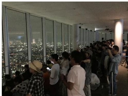
「特別観覧エリア」の様子（2018年）