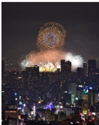
「ハルカス300」から見る 「なにわ淀川花火大会」