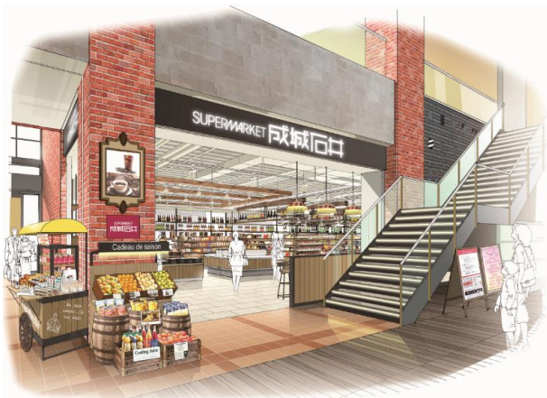
店内エントランス