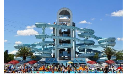
▲橿原市総合プール

橿原市総合プール内売店をご利用いただける 「ソフトドリンク1杯無料券」をプレゼント!