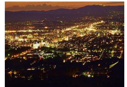
▲若草山山頂からの夜景